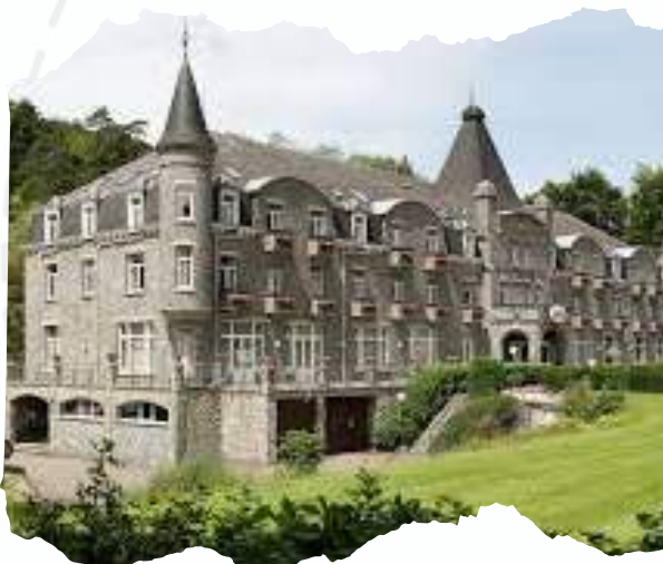
WANDELWEEKEND LA ROCHE

Voor alle informatie verwijzen we graag naar ons volgend magazine of naar onze website samac.be of onze facebookpagina.