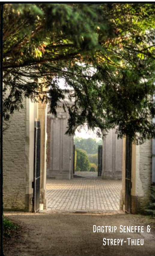
DAGTRIP SENEFFE & STREPY-THIEU